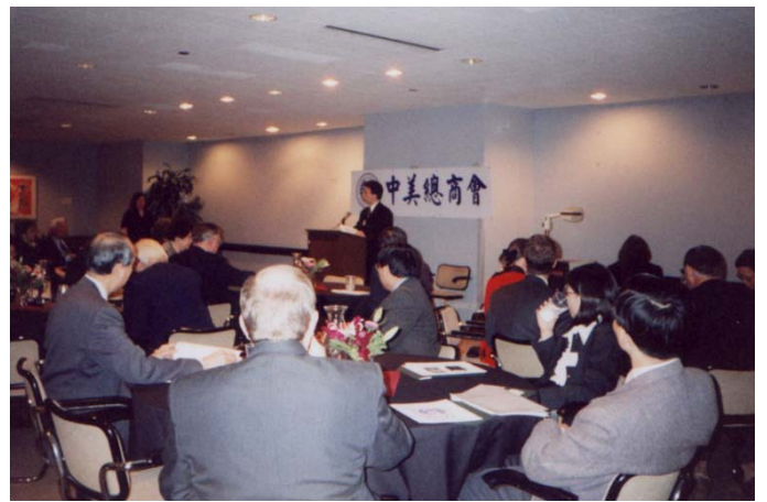
中美总商会经常性举办的研习会, 商议各种不同事宜