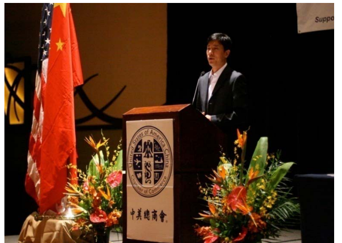
百度创始人、总裁/首席执行官李彦宏发言, 谈论关于电子商务对中国经济的影响