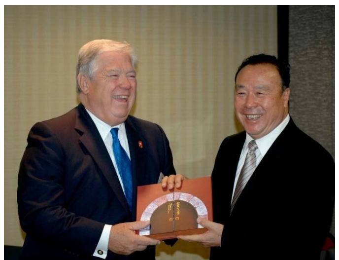
前密西西比州州长、前美国全国共和党主席、前美国共和党州长联合会会长哈雷·巴伯尔先生 (Haley Barbour)与中国政协副主席白立忱先生